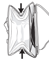
④ 矢印部分を押しなが、底部分を折り畳みます。