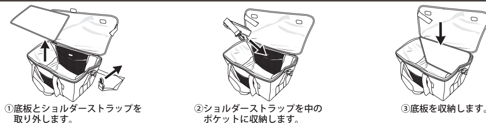
① 底板とショルダーストラップを取り外します。